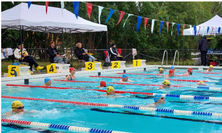
Start 1500 m

Simning – Totalt hade RIF med 18 deltagare, de flesta på 1500 m. Vädret var på vår sida med tanke på att simningen genomfördes utomhus. Inte kul att bli blöt på torra land.