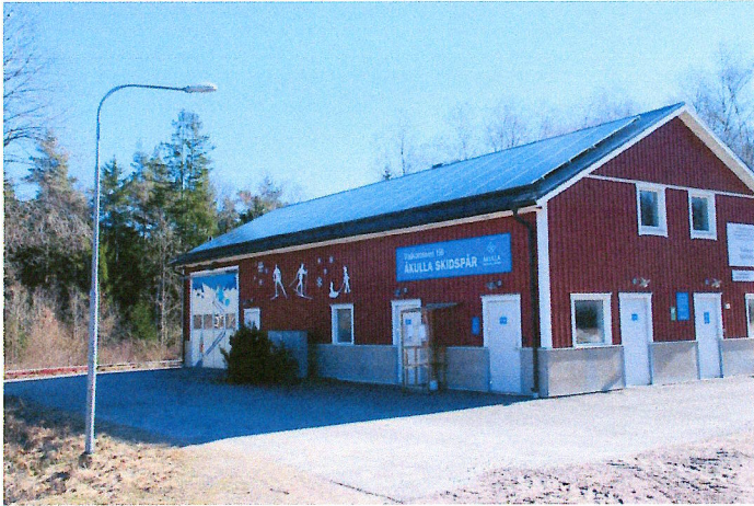
Servicehuset täckt med solceller

Anläggningen driftsattes i slutet av mars och beräknas ge merparten av energin som krävs för snötillverkningen, räknat på årsbasis.