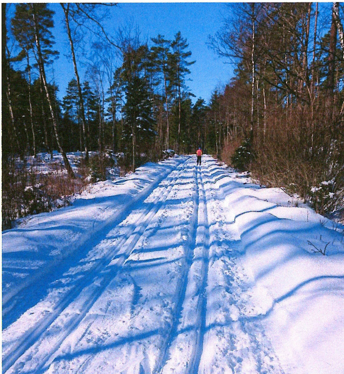
Natursnö på banvallen 2023-03-10

Spårsektionen har haft stora utmaningar pga det ombytliga vädret. Ändå har spåren genomgående fått mycket goda betyg av skidåkarna. Utkörning av snö startade den 14 december och var färdigt lagom till jul, då stadionslingan, mosslingan och tillverkningsplatsen hade åkbara spår. Innan snötillverkningen startade togs ett beslut om att inte lägga snö på skogslingan. Vid ett par tillfällen har natursnö hjälpt oss att ha spår på hela slingan plus ytterligare 1 km på banvallen.