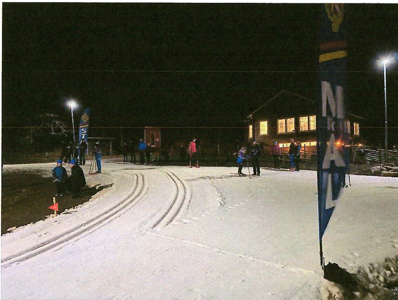
Spårbild från DM-tävling som kördes i plusgrader men mha saltning var spåren fasta och fina

Tyvärr inleddes det nya året med en längre period av plusgrader och mycket blåst. Trots detta kunde spårmakarna hålla spåren i åkbart skick. Under februari och mars blev vädret bättre och säsongen avslutades med några fantastiska helger med tusentalet besökare. Totalt kunde anläggningen hållas öppen i 101 dagar.