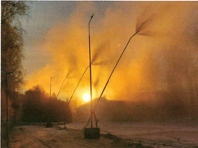
Snö tillverkning i morgonsol

Snösektionen har haft en hektisk säsong. Utrustningen för att tillverka snö har utsatts för stora påfrestningar. Kompressorn har behövt reparationer och naturligtvis sker detta när den behövs mest. Höga energipriser har också inneburit noggrann planering. Glädjande nog sjönk priserna längre fram under säsongen vilket gjorde att elbudgeten klarades med råge.